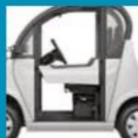
ČTVRTOVÉ PEVNÉ DVEŘE

Odmontovatelné varianty pevných dveří zlepšují bezpečnost a ochranu proti vnějším vlivům.