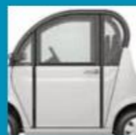
PLNÉ PEVNÉ DVEŘE