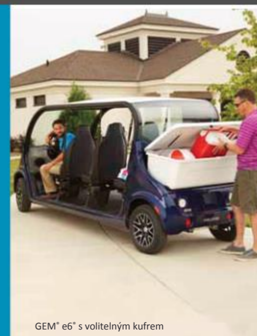
GEM® e6® s volitelným kufrem