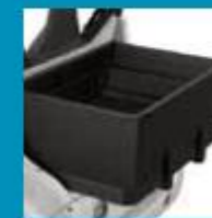
S PEVNÝMI STRANAMI